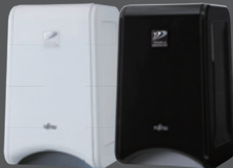
DAS-15C-W (ホワイト) DAS-15C-B (ブラック)