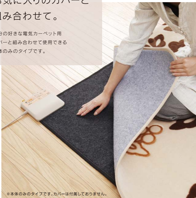
※本体のみのタイプです。カバーは付属しておりません。

自分の好きな電気カーペット用 カバーと組み合わせて使用できる 本体のみのタイプです。